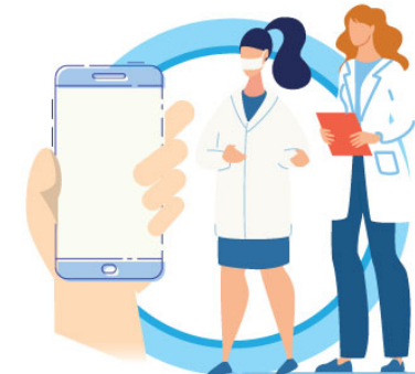
В СЛУЧАЕ ЗАБОЛЕВАНИЯ ОБРАЩАЙТЕСЬ К ВРАЧУ